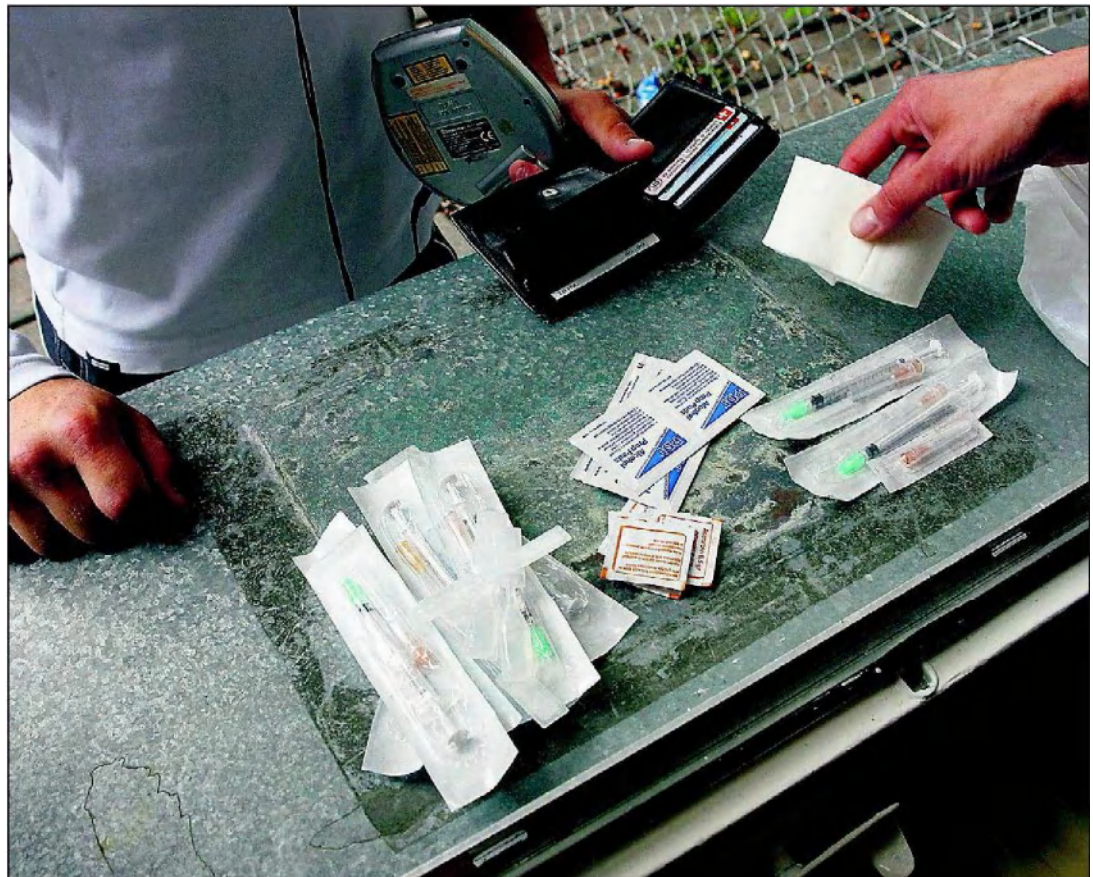
Durch verunreinigte Spritzen verbreiten sich unter Drogensüchtigen Krankheiten wie Aids oder Hepatitis, mit der Spritzenabgabe kann diesen Gefahren entgegengewirkt werden.

* Der Autor ist EDU-Nationalrat. Die EDU hat gegen die Revision des Betäubungsmittelgesetzes das Referendum ergriffen und setzt sich auch aktiv gegen die Hanfinitiative ein.